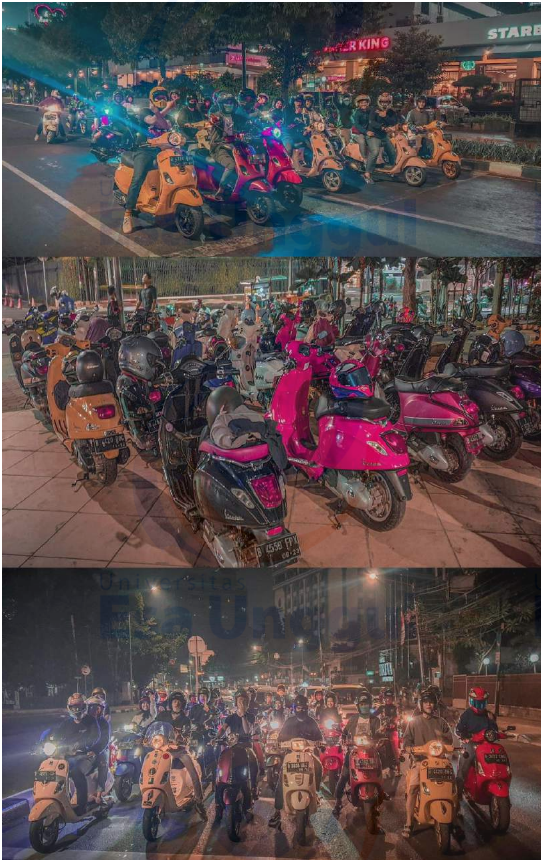
Gambar 3. Kegiatan Kopdar