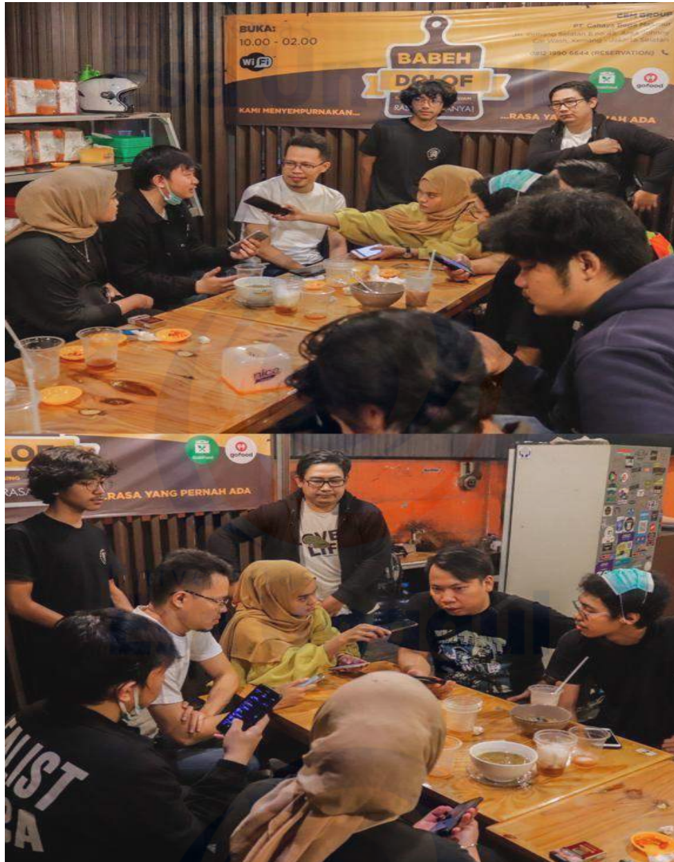
Gambar 7. Saat wawancara dengan anggota dan ketua