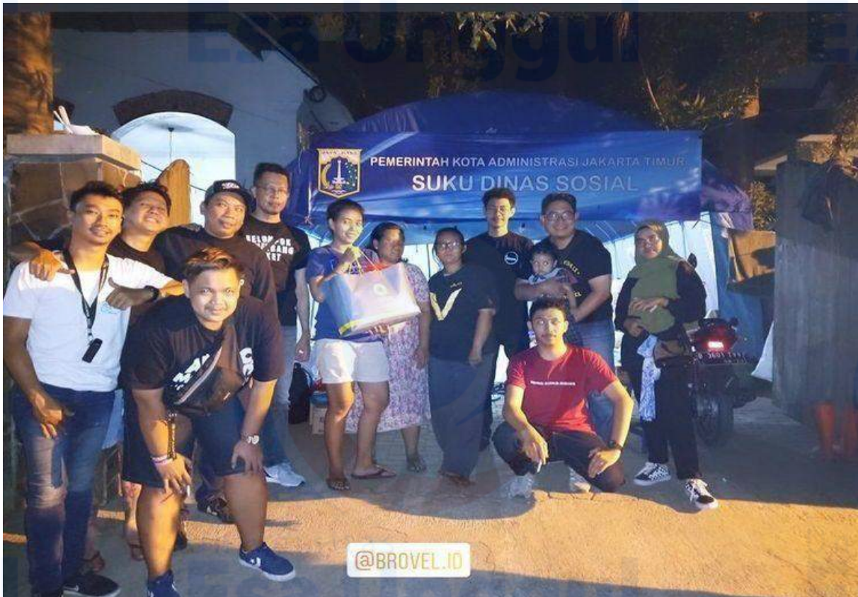
Gambar 6. Kegiatan Bakti Sosial