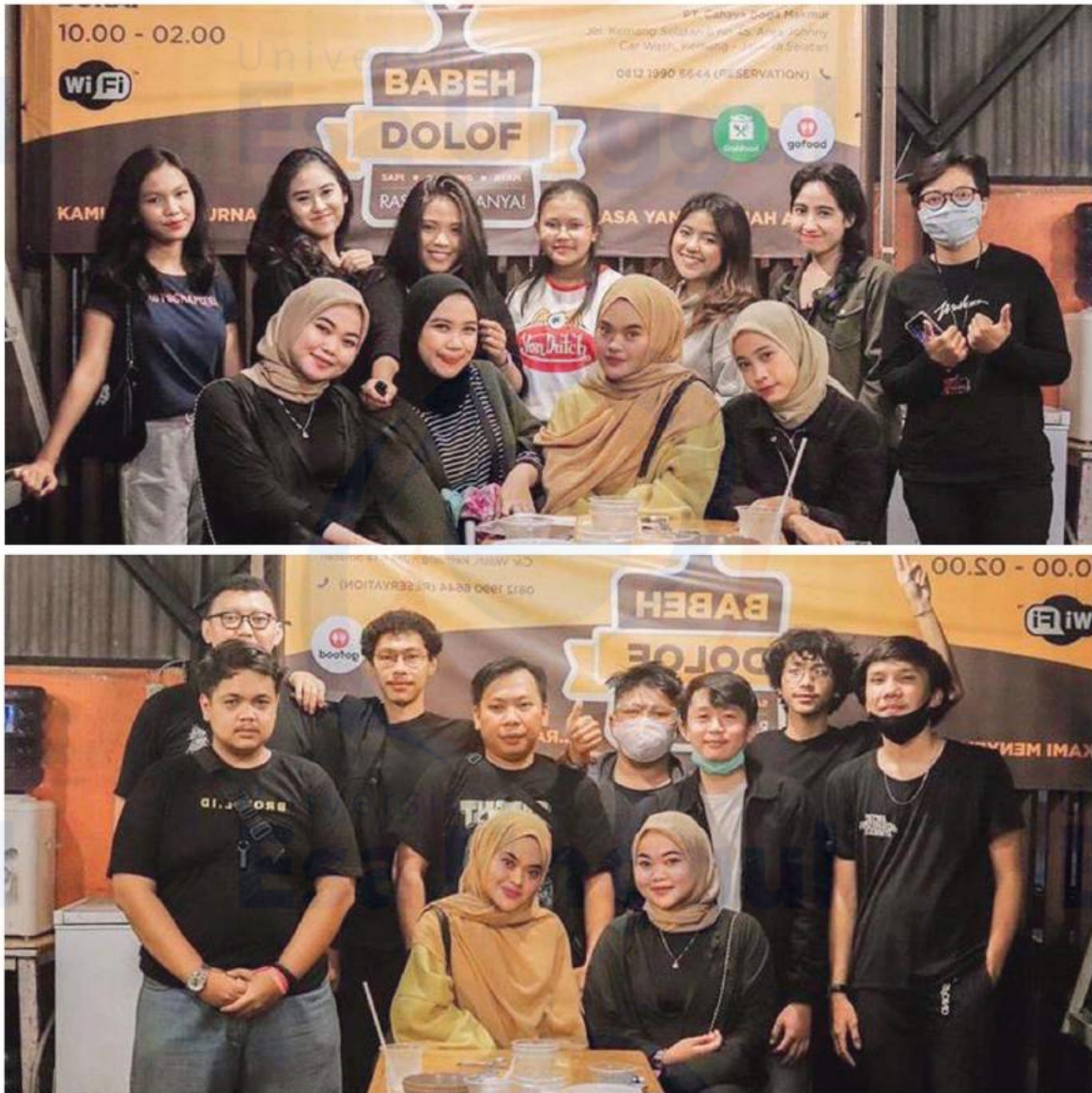
Gambar 8. Struktur keorganisasian komunitas vespa brovel