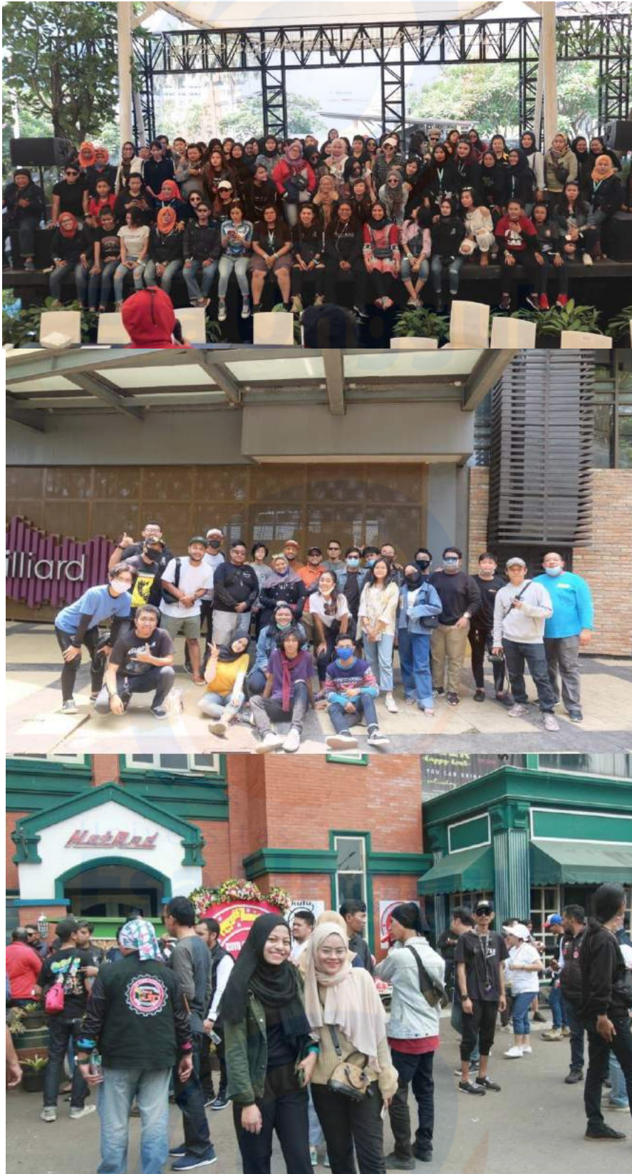
Gambar 4. Kegiatan Kunjungan Ke Komunitas Lain/Rolling